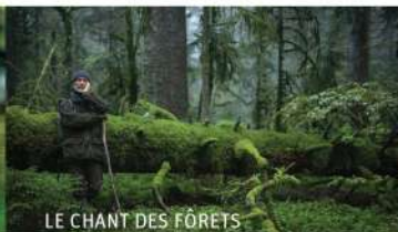
LE CHANT DES FORÊTS